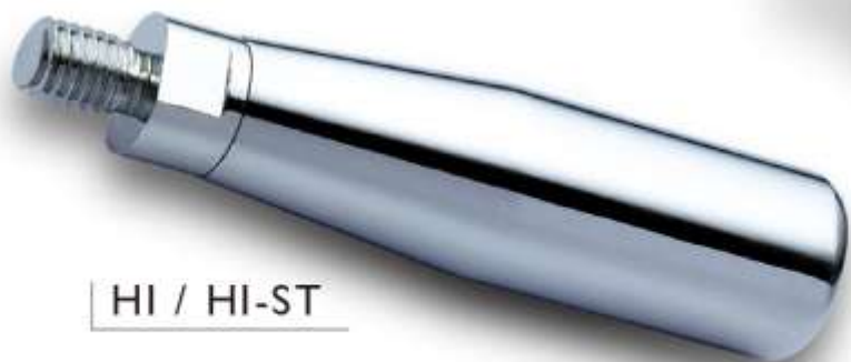
HI / HI-ST