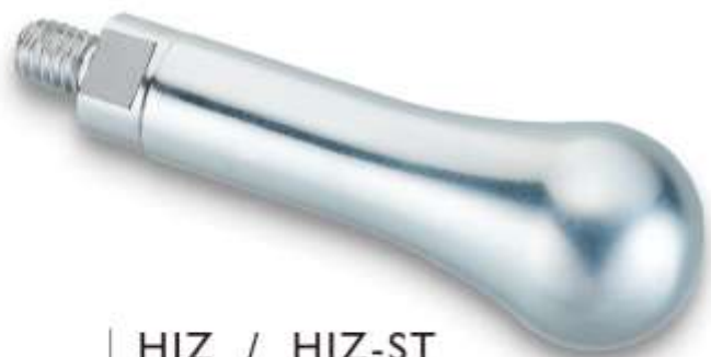
HIZ / HIZ-ST