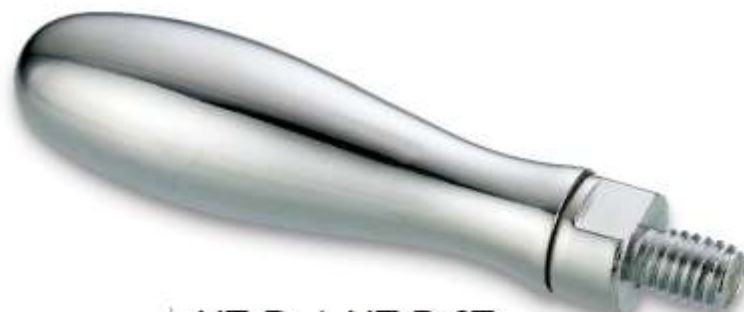
HZ-D / HZ-D-ST