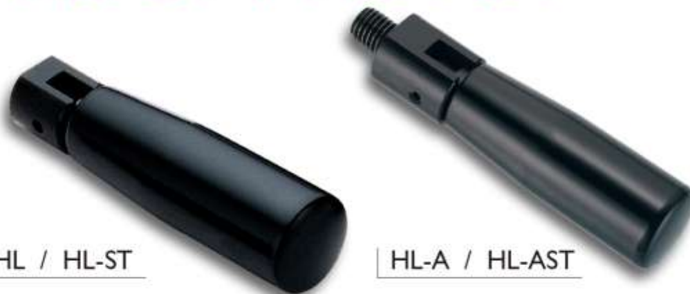
HL / HL-ST